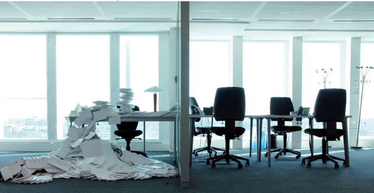
Fugato , 2010 Installation éphémère, livres, dimensions variables

À partir d'un matériau symbolique et caractéristique de leur pratique – un livre blanc –, le collectif 1.0.3 réalise des installations éphémères et virtuoses qui viennent temporairement investir espaces de travail et de circulation. Tous les quinze jours, une nouvelle sculpture, chaque fois différente des précédentes, apparaît et vient peupler de sa poésie un étage de la Tour Vista. Conçue dans le mois suivant le début de leur Résidence, Fugato a été la première œuvre de cette série toujours en cours. Ces livres blancs sont-ils les doubles de ce collectif, de ces artistes en immersion dans un environnement à découvrir ?