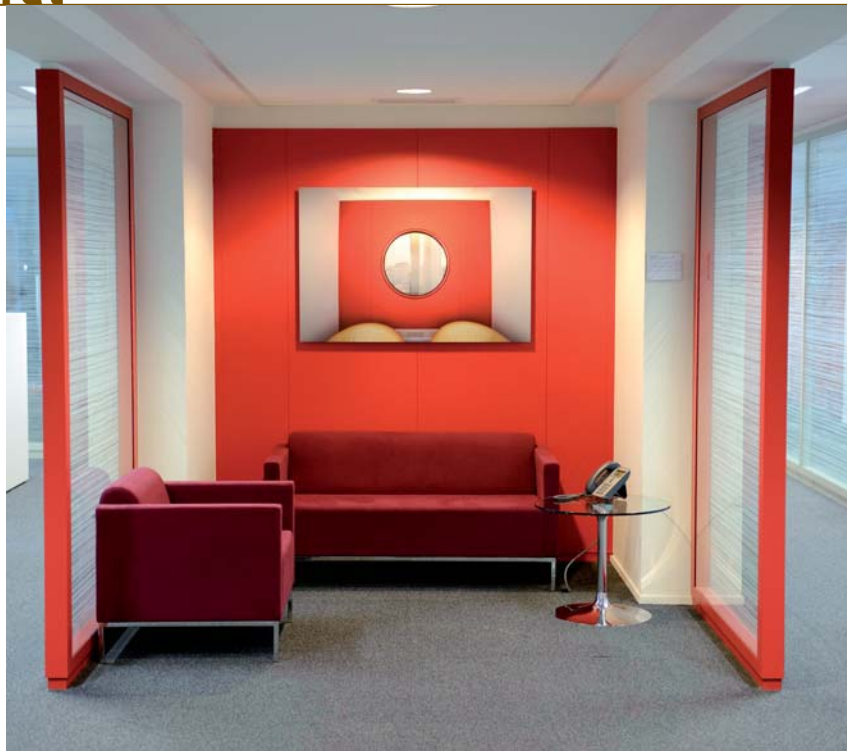
Dans l'art on est plutôt dans l'être , 2009 Photographie contrecollée sur dibond, 80 x 120 cm Vue d'installation, espace d'accueil, 21 e étage, Tour Vista

■ Avec cette photographie très construite, Barbara Noiret se joue du brouillage des repères et des perspectives. La Tour Vista, paquebot surplombant les environs, devient un poste d'observation du réel, un univers clos où l'immersion se fait en apnée.